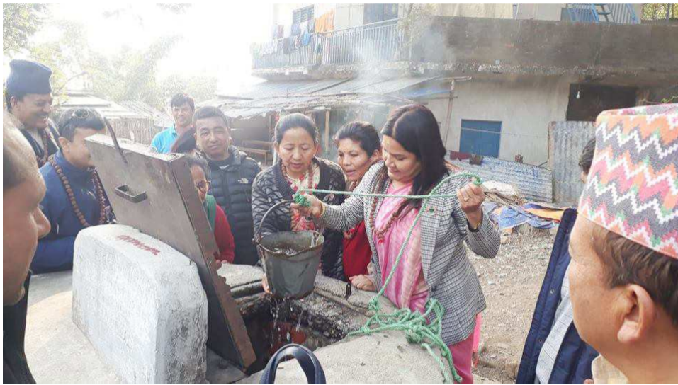
भ्रमणवर्षमा विजयपुरको पर्यटकिय पूर्वाधार बारे छलफलका लागि आएको प्रदेश सरकारको पर्यटन समितिको टोली पिण्डेश्वर मन्दिर स्थित इनारको जल सेवन गर्न निकाल्दै।

धरान (भरतराज शर्मा): नेपाल भ्रमण वर्ष २०२० मा धरान आउने वाह्य एवं आन्तरिक पर्यटकहरूको पहिलो घुमघामको रोजाई विजयपुर स्थित ऐतिहासिक तथा धार्मिक स्थलहरू नै हुने भएकाले यहाँको पूर्वाधारको विकास, स्तरोन्नती तथा सुधारका कार्यहरूको बारेमा प्रदेश सरकारको सम्बद्ध समितिले मंगलवार स्थलगत रूपमा विजयपुरमा सरोकारवालाहरूसँग छलफल गरेको छ। प्रदेश सरकारको उद्योग पर्यटन वन तथा बातावरण मन्त्रालयको उद्योग पर्यटन वन बातावरण समितिको टोलीले विजयपुरको पर्यटकिय टाइम्सको अवलोकन गर्नुका साथै छलफल कार्यक्रममा सहभागी भएको हो।